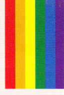
Drapeau du mouvement LGBT

Personne hétérosexuelle qui soutient l'égalité des droits et des sexes, le mouvement LGBT, ainsi que la lutte contre l'homophobie et la transphobie